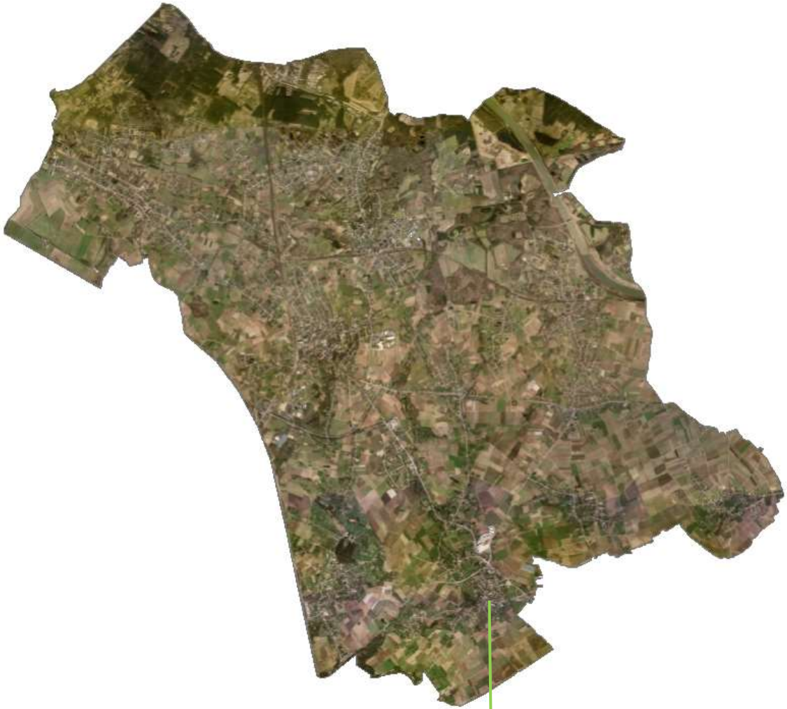
Blondeswinning – Grote Spouwen