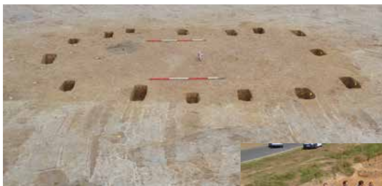
Paalkuilen van een woning.