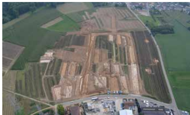
Luchtopname van de werkzaamheden aan de Spelver- en Kapittelstraat.

Verspreid over het terrein zijn vondsten aangetroffen die dateren uit de steentijden. Hoewel geen concentraties zijn aangetroffen, is het duidelijk dat het terrein al vanaf de oude steentijd (het paleolithicum) door de mens bezocht is. Het oudste voorwerp is een kling van vuursteen die ongeveer 12.000-10.000 jaar oud is. Daarnaast is een deel van een zogenaamde geslepen bijl gevonden. Dergelijke bijlen zijn in gebruik geweest in de jonge steentijd (het neolithicum) tussen 5700 en 3500 voor Chr. De bijl is aangetroffen in een kuil die uit de ijzertijd dateert. Mogelijk is de bijl in de ijzertijd teruggevonden en toen opnieuw gebruikt.