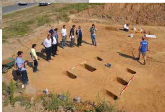
De pers op bezoek.

De snede van een geslepen bijl uit de nieuwe steentijd (5700-3500 voor Chr.)