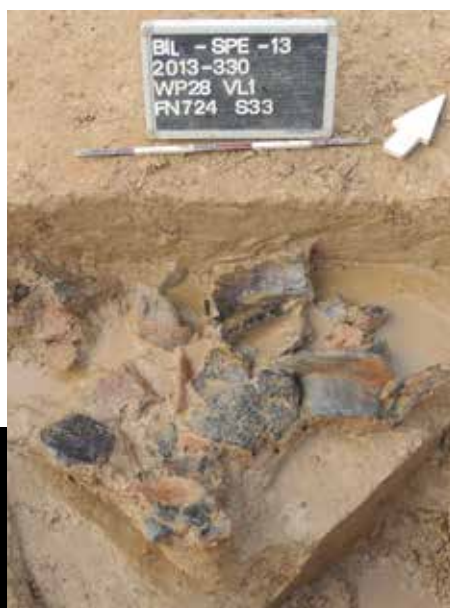
Verbrand aardewerk uit de vroege ijzertijd (800-500 voor Chr.), aangetroffen in een kuil. Is het een verlatingsoffer?