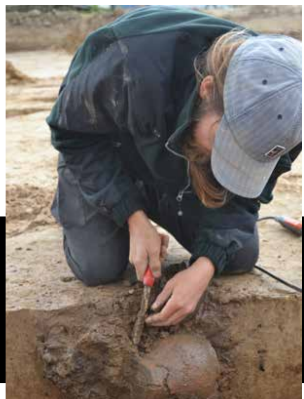
Een pot uit de late ijzertijd (250-50 voor Chr.) in een kuil.